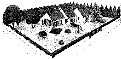
Plutôt qu'une haie monospécifique uniforme ....